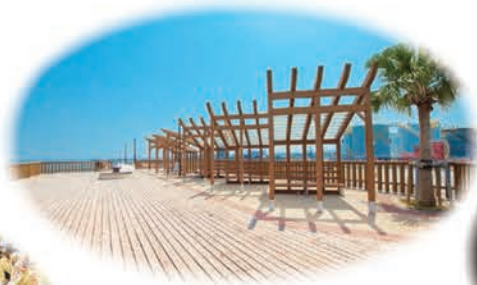
小松島みなとオアシス